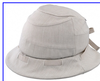
株式会社オージーケーカブトのヘルメット