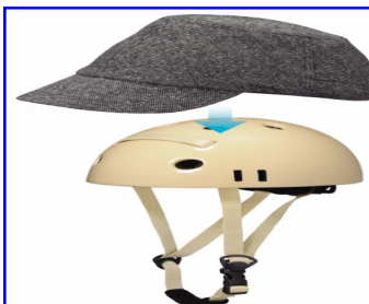
株式会社日本パレードのヘルメット（通称カポル）