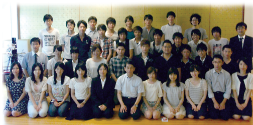
(地域枠学生・自治医科大学学生合同セミナー in 湯原：H24.8)