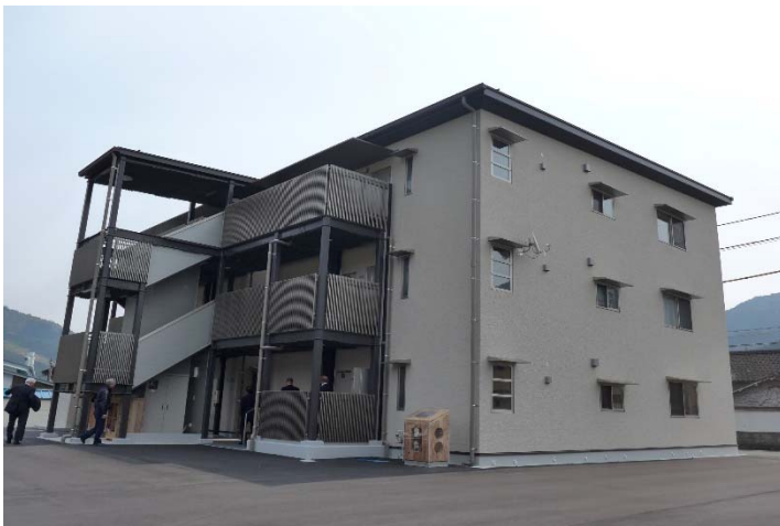
共同住宅 (真庭市内)