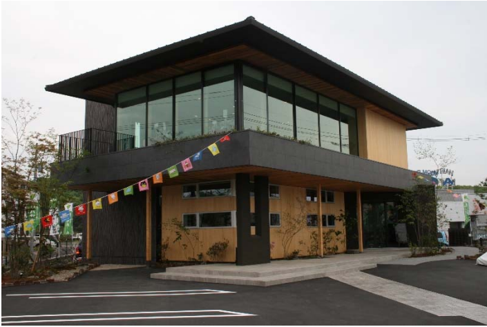
住宅展示場 (倉敷市内)