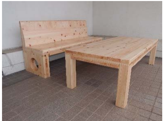
テーブル及びベンチ (岡山空港ターミナル)

お問い合わせは、県庁林政課又は最寄りの県民局森林企画課へお願いします。 なお、 申請書の提出は事業実施箇所を所管する各県民局へお願いします。