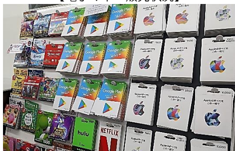
コンビニでは様々な電子マネーカードを販売しています。