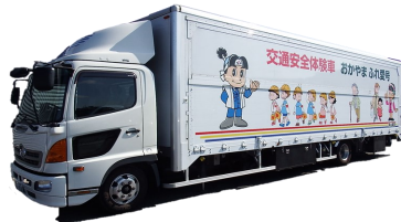
【おかやまふれ愛号】